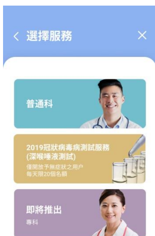
4) 選擇服務— 普通科