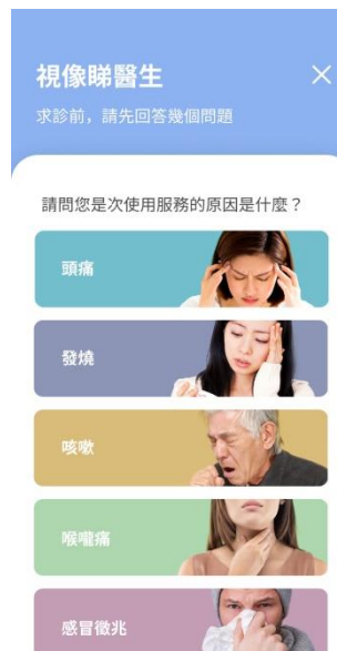
6) 輸入求診原因及相關資料